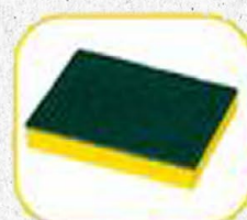
Buchas de lavar louça