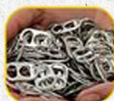
Lacres de latinhas