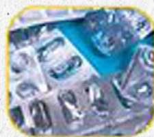
Cartelas de remédios